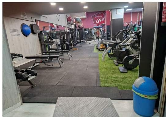
Gimnasio Universitario- Gimnasio Victoria C/Romero 18