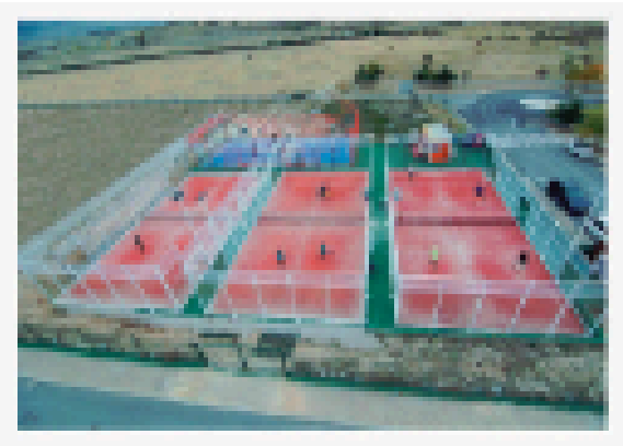
Pistas Pádel y Tenis Espacio Tierra Bus M-4